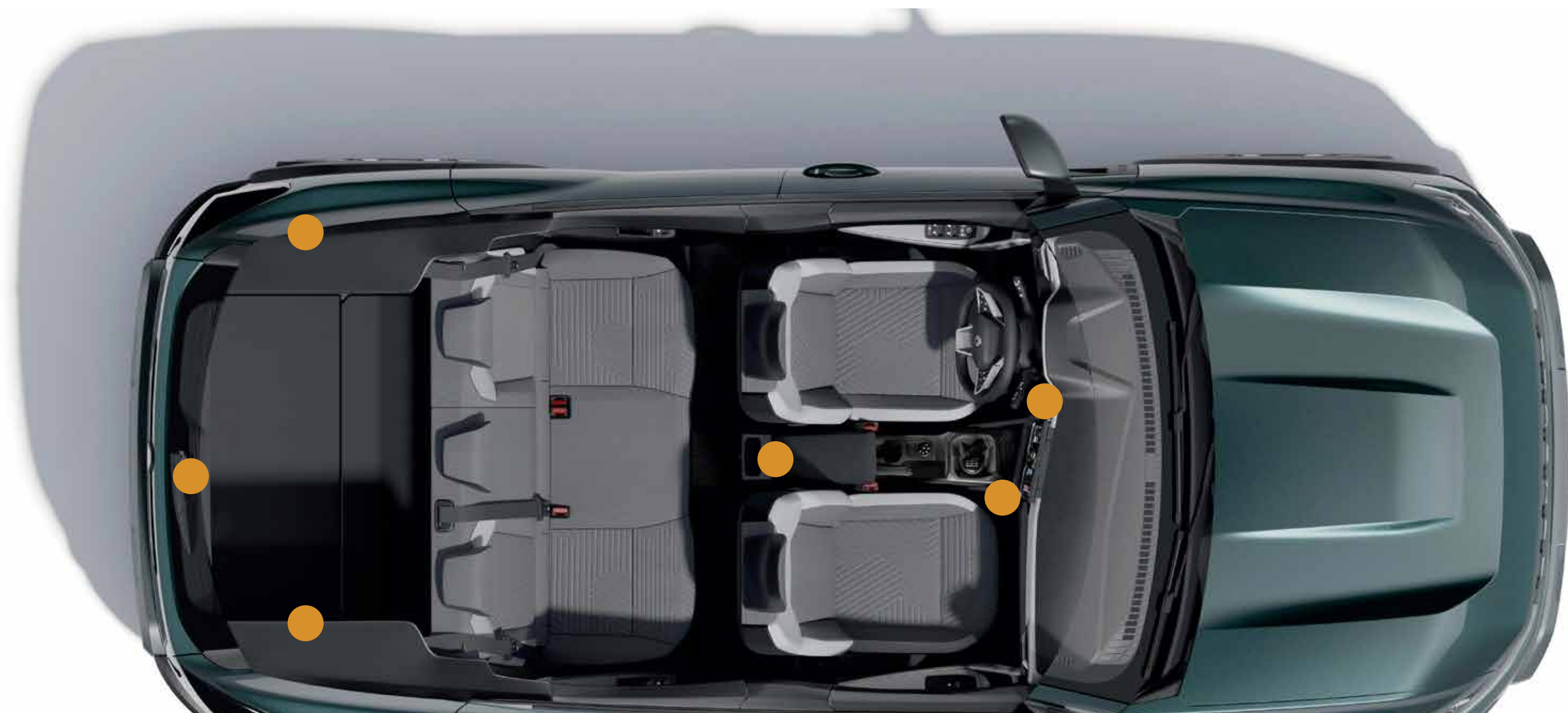
6 puntos de anclaje YouClip

La innovación del sistema YouClip con 6 puntos de anclaje distribuidos desde la parte delantera hasta el baúl, permiten fijar de forma segura diversos objetos en todo el vehículo.