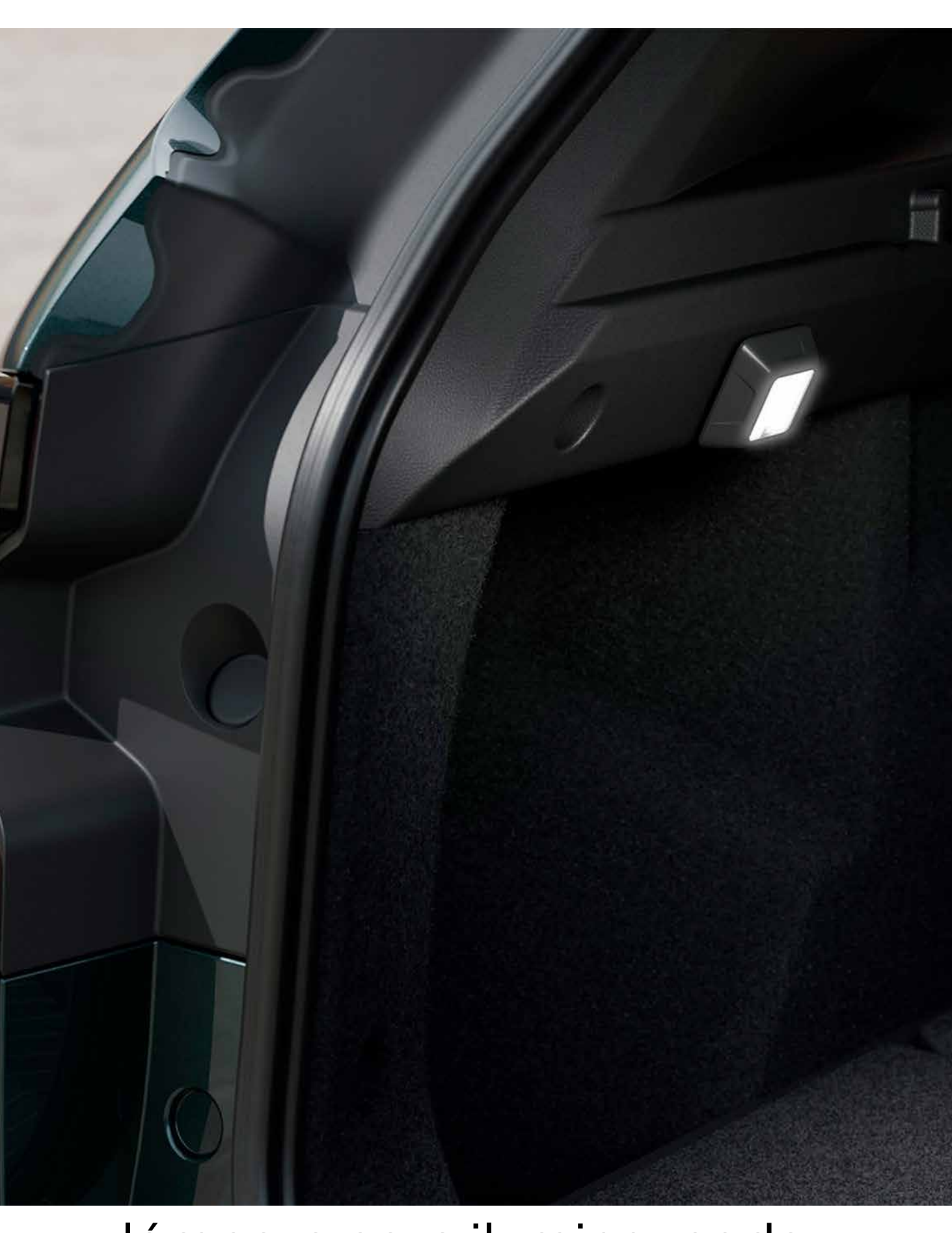
lámpara para iluminar cada rincón*

Con los anclajes YouClip puedes acceder a accesorios como el sistema inteligente 3 en 1 donde tienes en el mismo lugar una luz, un portavasos y un gancho para tu bolso o gorra.