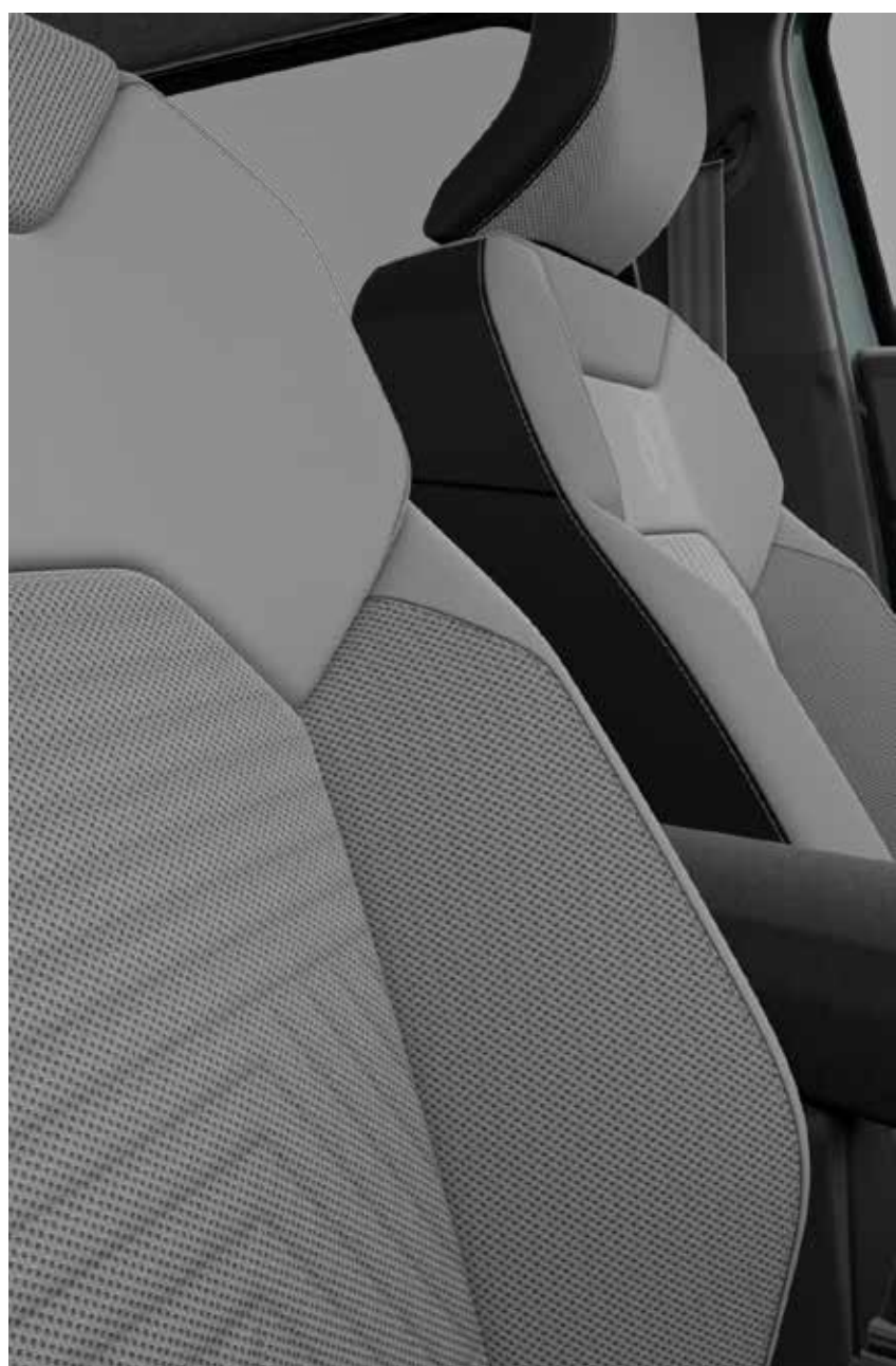
tapicería en tela