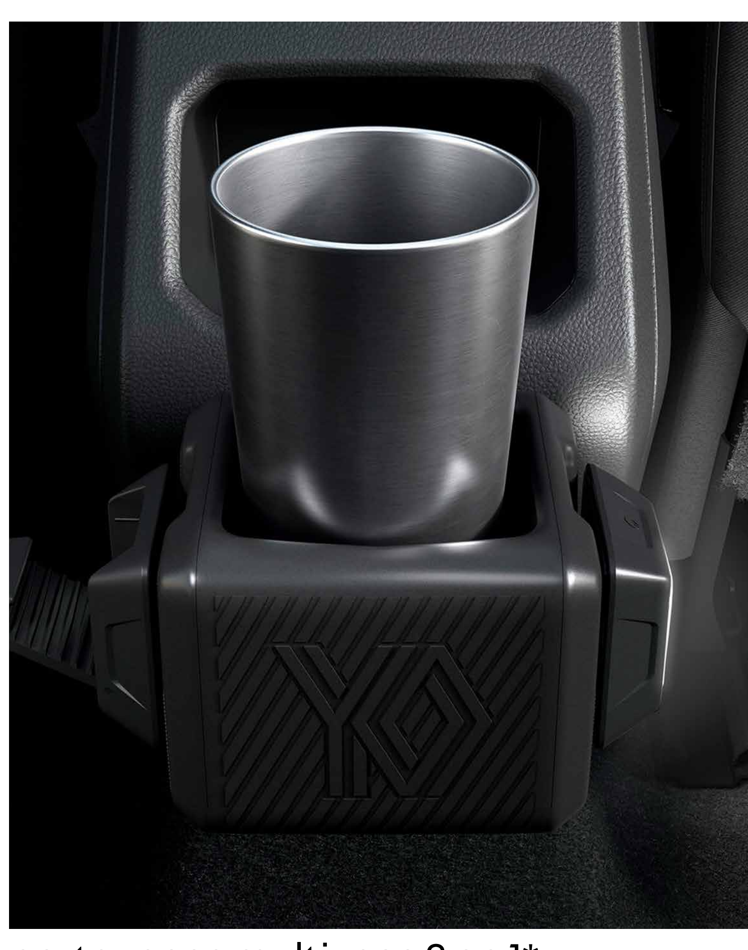
portavasos multiusos 3 en 1*