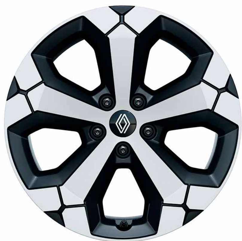
rines de aluminio de 18" con acabado diamantado

Las imágenes que se encuentran en este catálogo son de referencia. La versión comercializada en Colombia puede variar en diseño, accesorios y acabados. Imagen y características corresponden únicamente a la versión Renault Duster E-Tech Techno modelo 2027. Los equipamientos pueden variar según su versión.